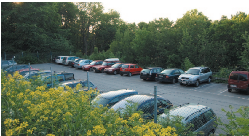
P-hagen vid garage P2.

siktning av lägenheter. Den huvudsakliga anledningen till besiktning är att minimera risken för vattenskador etc, vilka varje år orsakar stora kostnader för föreningen.