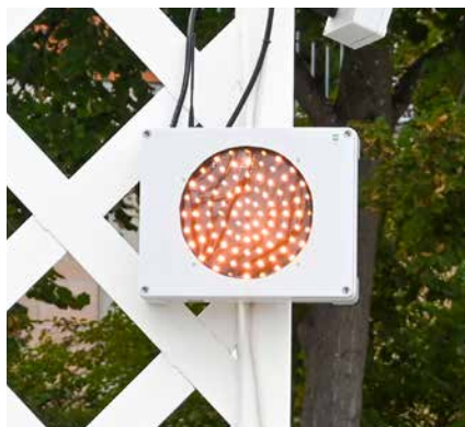
Gångtrafikantvarnare som blinkar gult när någon närmar sig på trottoaren finns vid utfarterna från garagen. Hastighetsvarnare finns vid vid infarten vid garage P1 och i backen efter garage P2.

På samma gång vill vi påminna om att det är 30 km/tim på Svartviksslingan, i hela Minneberg, vilket många verkar ha glömt bort!