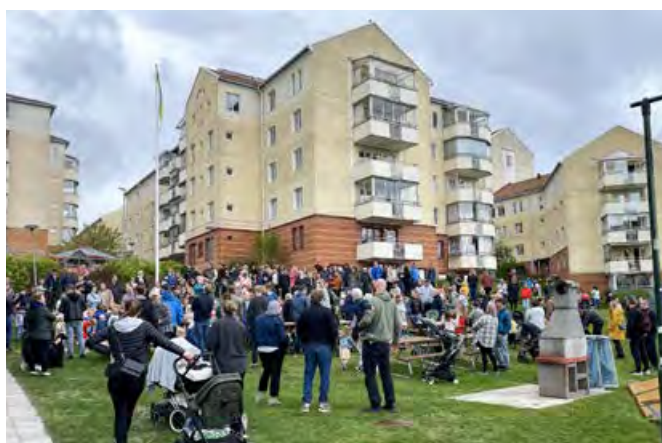
Uppvärmning inför Minnebergsloppet.