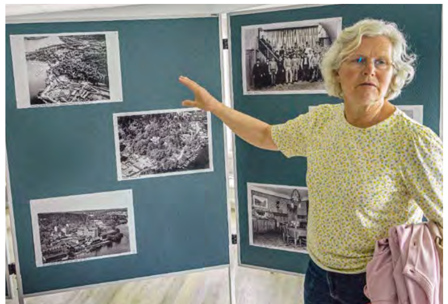
Bromma Hembygdsförenings ordförande framför utställningen med bilder från förr.